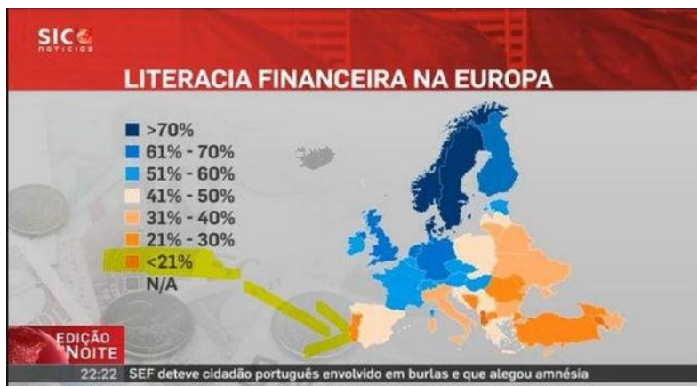
Figura 1: Sic Notícias – Gráfico ilustrativo dos níveis de Literacia Financeira na Europa

“Portugal no último lugar do ranking de literacia financeira da zona Euro” (Araújo, Portugal no último lugar do ranking de literacia financeira da zona Euro, 2022)