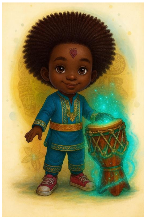
Figura 1. Personagem Zaki

“ As Aventuras Musicais de Zaki ” é uma peça autoral inédita, criada exclusivamente para este projeto pelo autor deste artigo. Ainda não publicada, a peça apresenta uma narrativa mágica e envolvente, ideal para despertar a imaginação e o interesse dos participantes por meio da riqueza cultural dos ritmos afro-brasileiros.