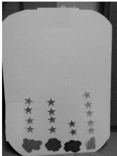
Figura 2 - Leaderboard

Nas duas sessões, a turma foi dividida em 4 (quatro) grupos, tendo cada um recebido uma estrela, cuja cor o identificava: os Blues , os Greens , os Yellows e os Reds . Em seguida, foi apresentado pela professora um “leaderboard” analógico (fig.2), que acompanhou a evolução de ambas as atividades, estando cada grupo identificado no mesmo com uma mancha da sua cor. À medida que as tarefas foram realizadas dentro do tempo estipulado, um elemento dos grupos vencedores colou uma estrela da sua cor. No final, foi efetuada a contagem das estrelas e o/s grupo/s que conquistaram mais, ganharam um prémio