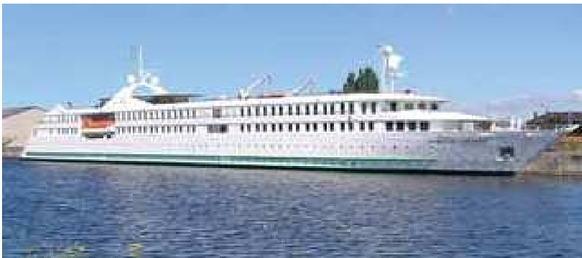
Figura 6- França, Cruzeiro MS Belle de l'Adriatique

O MS Belle de l'Adriatique percorre o Mar Mediterrâneo desde da Costa da Croácia até às Ilhas Canárias.