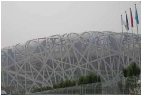
Figura 2- China, Estádio Olímpico de Pequim

As principais arenas utilizadas nos Jogos Olímpicos de Pequim estão automatizadas com a tecnologia KNX.