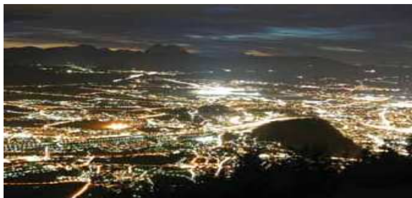
Figura 5 – Áustria, Central Publica de Iluminação de Salzburg

O sistema está construído em redundância. Existem dois sistemas idênticos a correr em paralelo, segundo o qual o sistema o primeiro sistema é executado como sistema primário. Se este sistema entra em modo de erro, o segundo sistema assume o controlo. Cada sistema auto verifica-se através da transmissão cíclica de mensagens de todos os KNX componentes para detectar avarias.