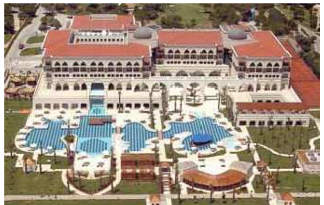
Figura 4- Turquia, Hotel Kempinski - The Dome, Antalya

O novo e luxuoso Hotel Kempinski, "The Dome", na paradisíaca praia de Antalya na Turquia, apresenta-se como um sonho das 1001 Noites. A arquitectura de um complexo edifício moderno faz lembrar o estilo Seljukian.