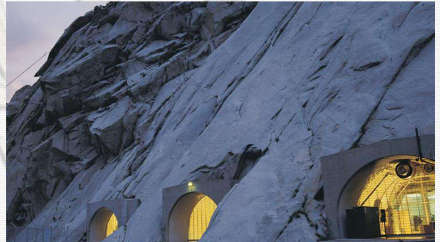
Granite Mountain Records Vault.